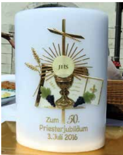
Jubiläumskerze der Pfarrgemeinde