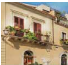
Andrea Camilleri DAS LABYRINTH DER SPIEGEL Commissario Montalbano wagt sich in gefährliche Gefilde Lilibe

Zwei mysteriöse Bombenattentate bereiten Commissario Montalbano ebenso Kopfzerbrechen wie seine neuen Nachbarn in Marinella: Liliana Lombardo