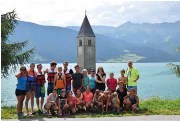
einige Badmintonspieler beim besonderen Sommertraining am Reschensee

Mit Juli hat somit das Sommertraining angefangen, das dieses Jahr hauptsächlich von Marcel Strobl geleitet wird, da unser Trainer Henri bis 15. August in Dänemark bei einem großen internationalen Talentcamp mitarbeitet. Drei Trainingseinheiten pro Woche stehen für die Top-Spieler auf dem Programm und 2 Trainingseinheiten für unsere Nachwuchskids. Im August gibt es das beliebte Intensiv-Sommerncamp für unsere Kinder und auch zwischendurch gibt es ein paar besondere