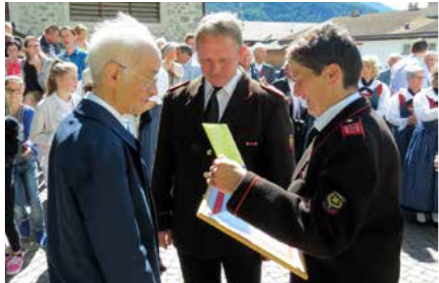
Freiw. Feuerwehr Burgeis gratuliert