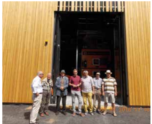
il gruppo di visitatori alla centrale