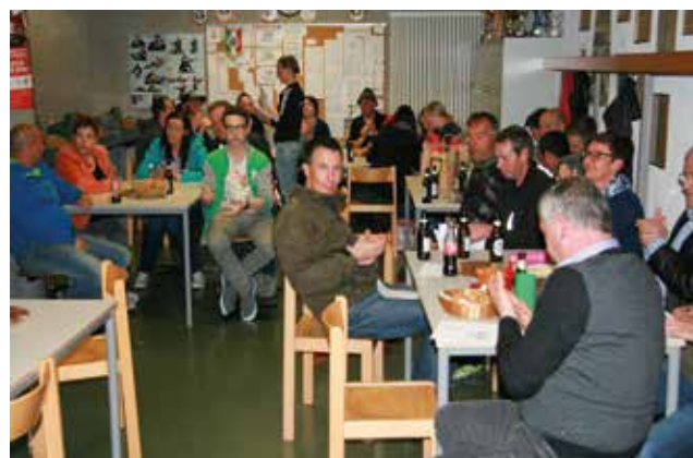
Anwesende bei Preisverteilung

Die Sportschützen Mals bedanken sich hiermit nochmals bei allen Teilnehmern, Helfern und Sponsoren!