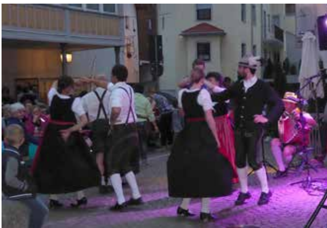
Einige Bilder beim Tiroler Festl